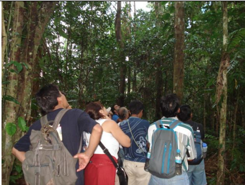
Observando aves, monos