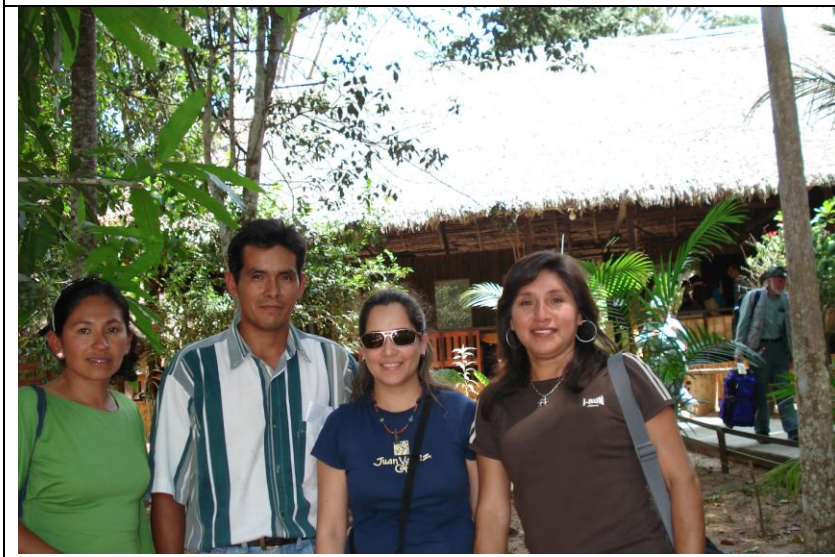
En las oficinas de Rainforest