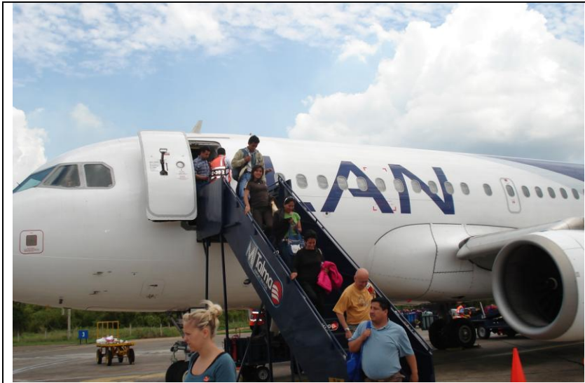
Llegada a Puerto Maldonado