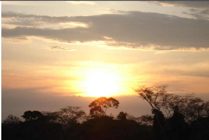
Atardecer en Madre de Dios, sobre la copa de los árboles